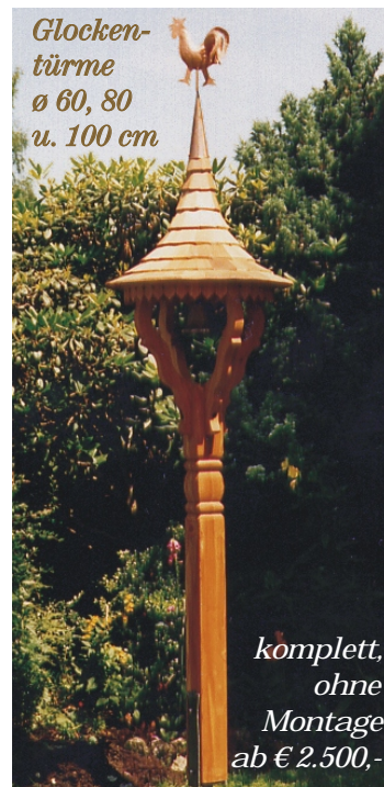
Glocken- türme ø 60, 80 u. 100 cm

Die genannten Preise gelten für Form 1 und 2. Andere Formen, Maße, Holzarten und Qualitäten. Preise auf Anfrage.