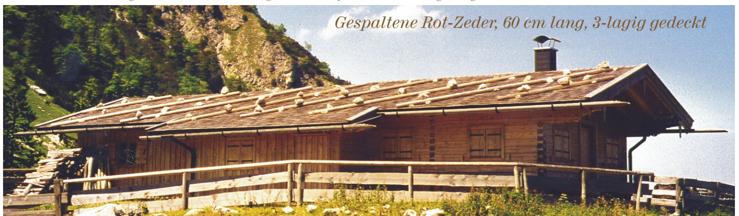
Gespaltene Rot-Zeder, 60 cm lang, 3-lagig gedeckt

● Diese Sorten unterliegen starken Preisschwankungen - hier bitte jeweils vor Bestellung anfragen!