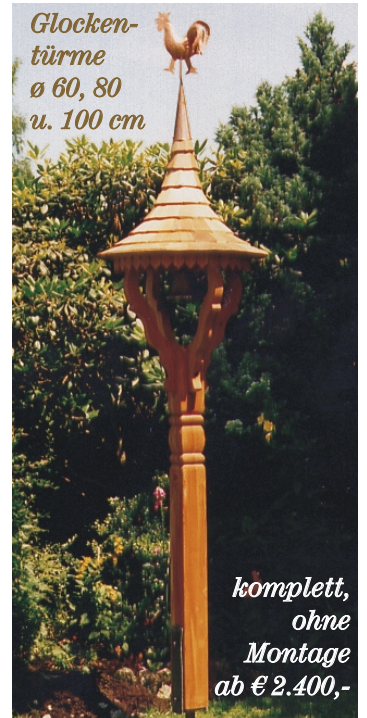
Glocken- türme ø 60, 80 u. 100 cm

Die genannten Preise gelten für Form 1 und 2. Andere Formen, Maße, Holzarten und Qualitäten. Preise auf Anfrage.