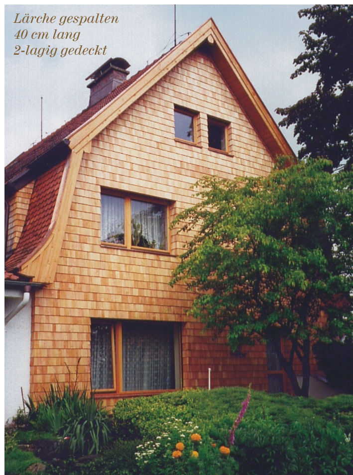
Lärche gespalten 40 cm lang 2-lagig gedeckt

Auf Wunsch können sämtliche Schindelsorten mit stumpfem Schindelfuß gegen Aufpreis von EUR 1,50 pro Breitenmeter, auch mit Fase geliefert werden.